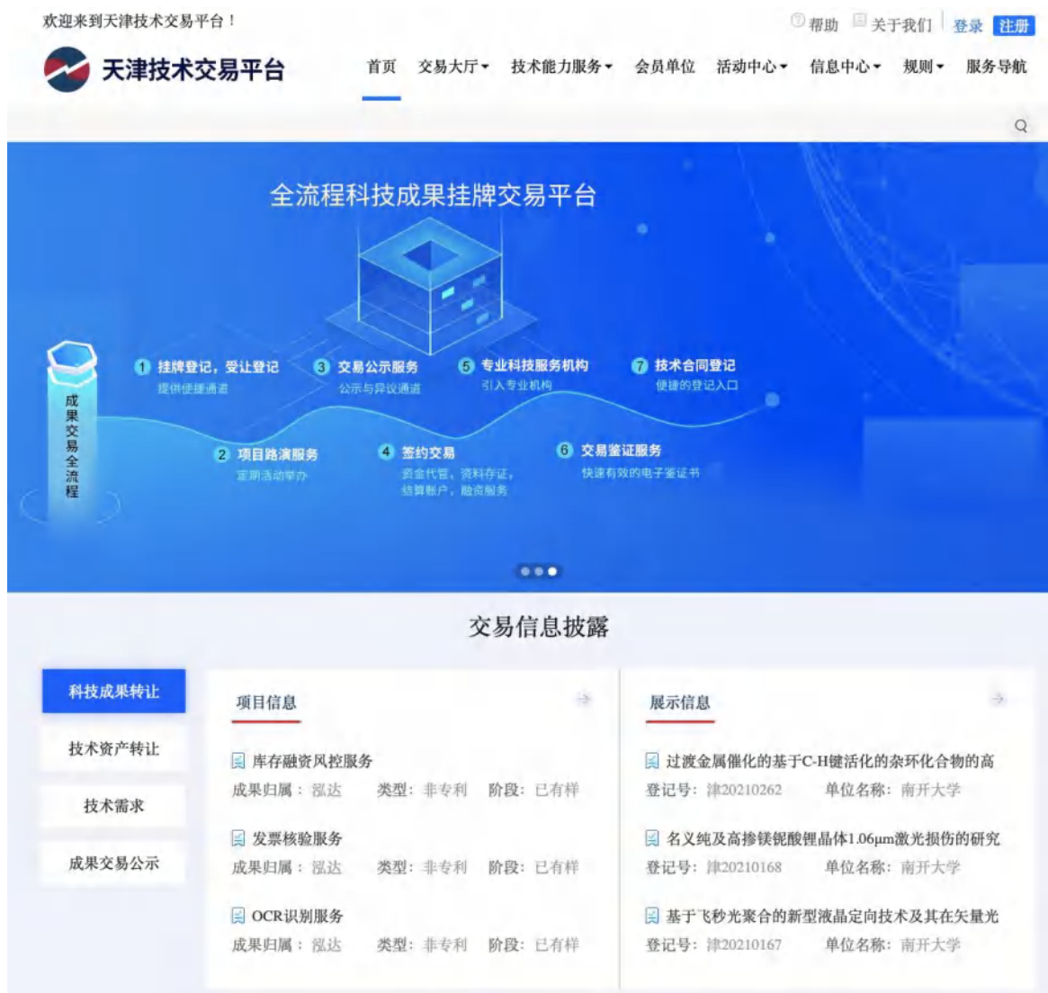
图 3 技术平台信息发布展示页面

发布交易信息时间不少于 10 个工作日,自技术平台网站发布次日起计算。信息发布期自首次发布之日起累计不超过 12 个月(在天津科技成果网同步发布)。