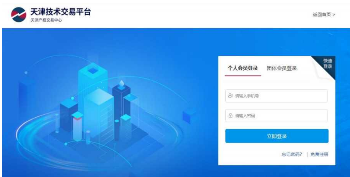
图 2 技术平台登录界面

技术平台对转让方提交的信息发布申请材料的规范性进行审核。符合信息披露要求的，技术平台予以受理；不符合信息披露要求的，技术平台将审核意见及时告知转让方或转让方经纪会员，要求转让方进行调整。