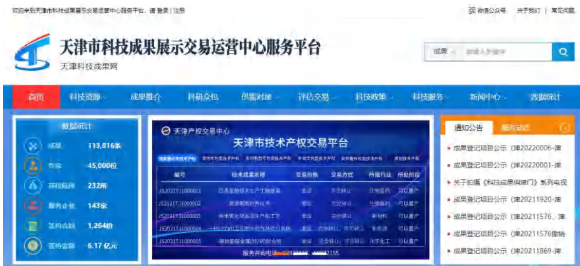
图 4 天津科技成果网项目展示页面

转让方在公告期间不得擅自变更或者撤销公告中的内容和条件。交易行为须经批准单位同意且确需变更公告内容和条件的，转让方应当取得交易行为批准单位书面同意，并由技术平台网站重新发布信息披露公告，重新计算公告时间。